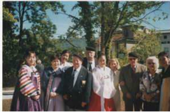
Inauguration du jardin Coréen.