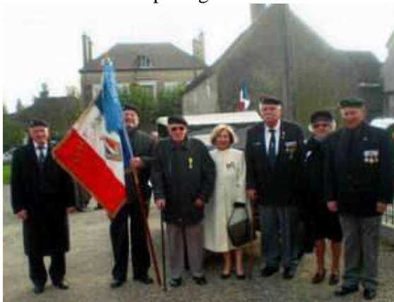
Cérémonie à Pagny-la-Ville

Le repas est pris en commun avec la famille qui nous offre les boissons.